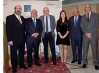
Cena de Gala del Club Financiero Antares

Cena de Gala del Club Financiero Antares