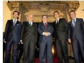
Foto de foto Luces, distinción y fados en el Pabellón de Portugal

Inauguración de la iluminación artística del consulado de Portugal